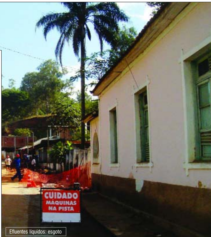
Efluentes líquidos: esgoto

O sistema utilizado para o tratamento dos resíduos é de fácil manutenção e a Prefeitura de Comendador Levy Gasparian já tem conhecimento das técnicas de manutenção utilizadas para o tratamento de efluentes líquidos.