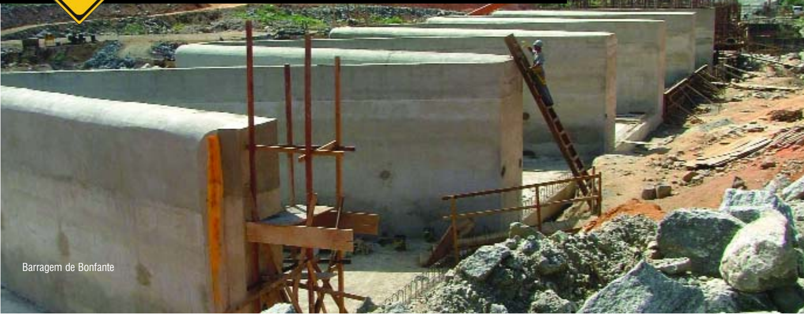
Barragem de Bonfante

A construção da barragem e as escavações da área da casa de força e do túnel de adução da PCH Bonfante continuam.