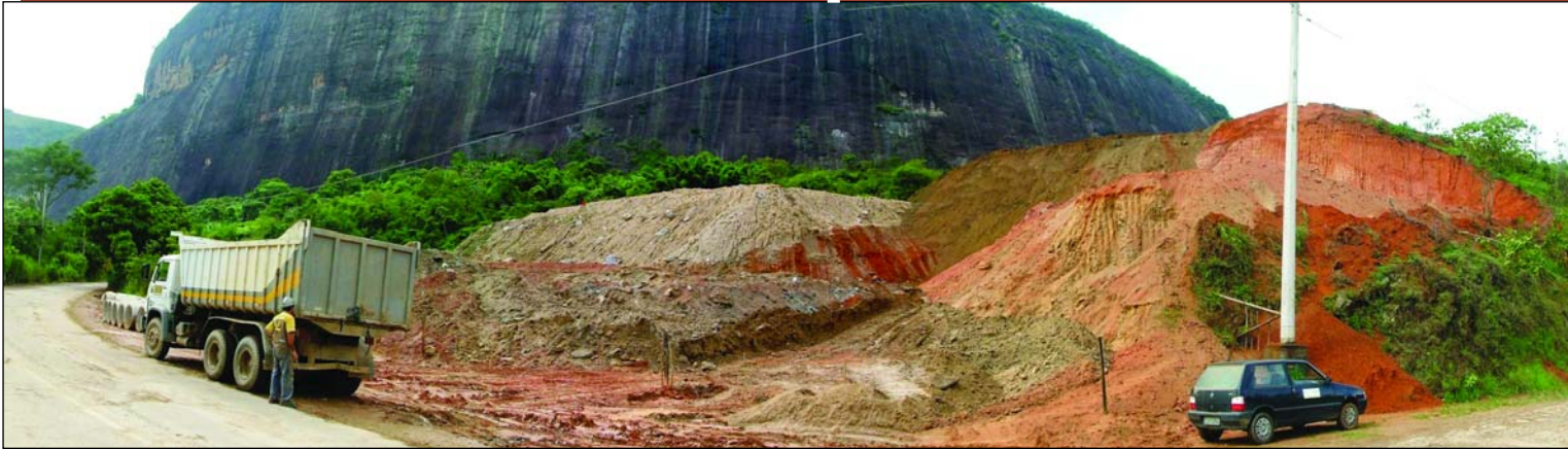
Vista geral das áreas de bota-fora (lado esquerdo) e empréstimo (lado direito). Estas áreas serão recuperadas após o término da atividade.