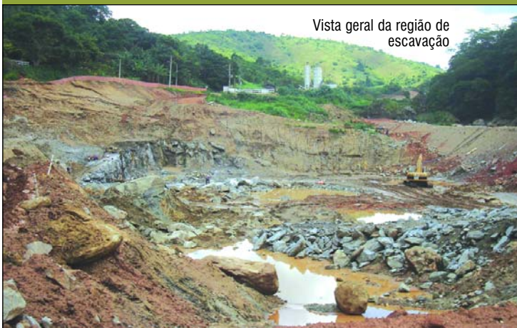
Vista geral da região de escavação