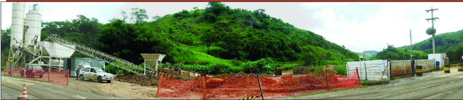
Vista geral da central de concretagem.