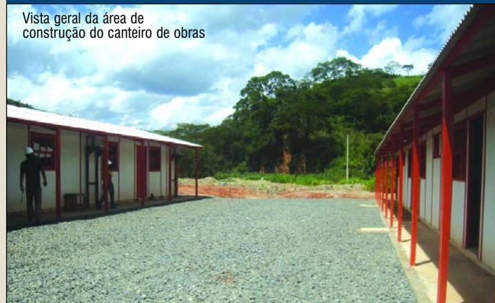
Vista geral da área de construção do canteiro de obras